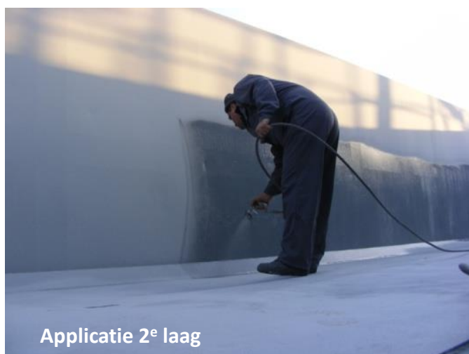
Applicatie 2 e laag

Op elk van deze 70 treinwagens werd 80 kg ZINGA verbruikt. 120 µm DFD in 2 lagen van elk 60 µm DFD werd aangebracht door een airless spuitpistool door de aannemer 'General Navorep'.