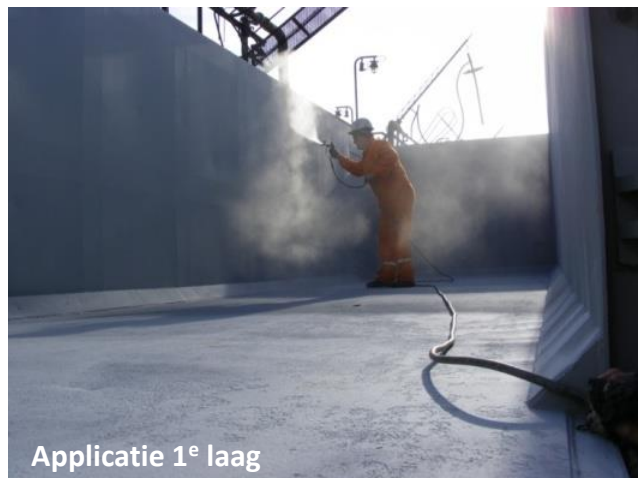
Applicatie 1 e laag

In November 2009 werd ZINGA gebruikt om 70 goederenwagens van ROMPETROL tegen corrosie te beschermen.