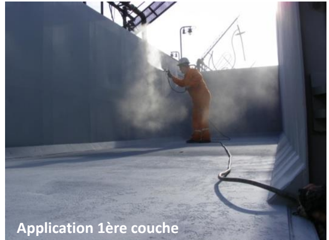
Application 1ère couche

En Novembre 2009, le ZINGA a été utilisé pour protéger 70 wagons de fret ferroviaire de ROMPETROL contre la corrosion.