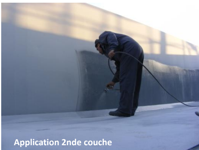
Application 2nde couche

Sur chacun de ces 70 wagons, 80 kg de ZINGA ont été consommés. 120 µm d'EFS en 2 couches de 60 µm d'EFS ont été appliqués au pistolet airless par le contractant «General Navorep».