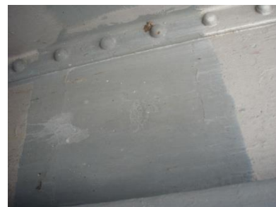
Burdekin Rivir Bridge

System: Oppervlakte voorbehandeling: Stralen tot de graad SA 2.5