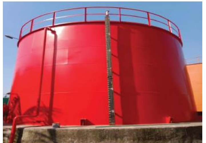
Applicatie van de PU eindlaag & oplevering aan de klant CLC POWER in November 2020