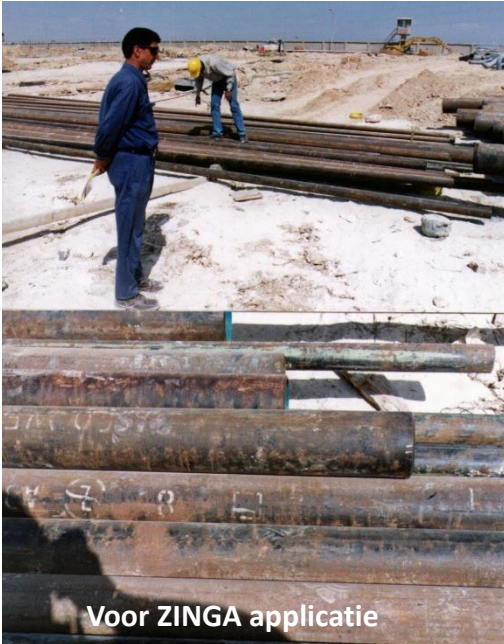
Voor ZINGA applicatie