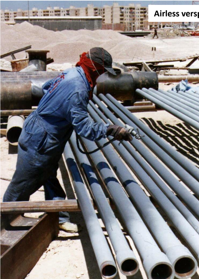
Airless verspuiten van ZINGA