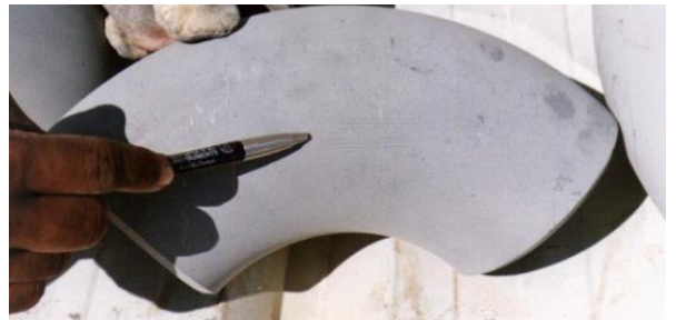
Na ZINGA applicatie