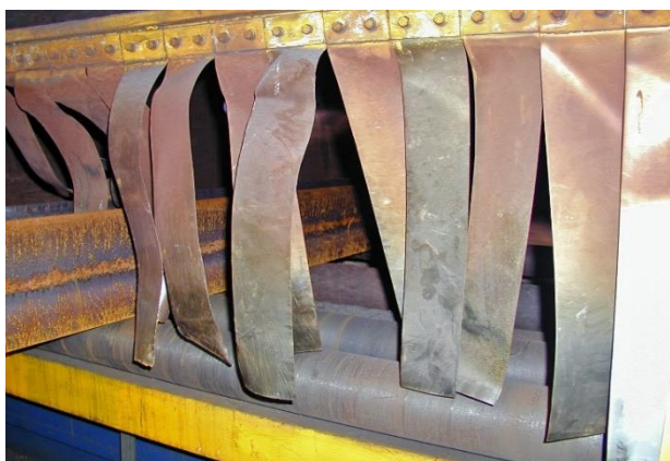
Procédé de brûlure