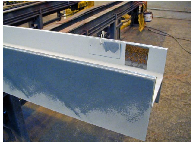
Contrôle de la tôle