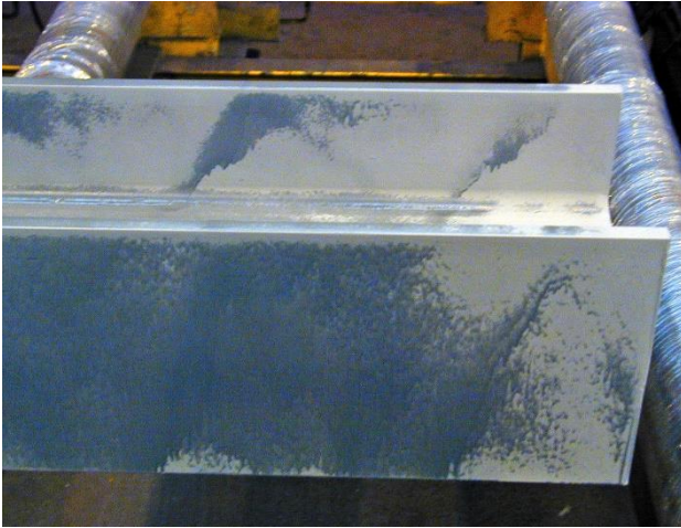
Pistolage du ZINGA