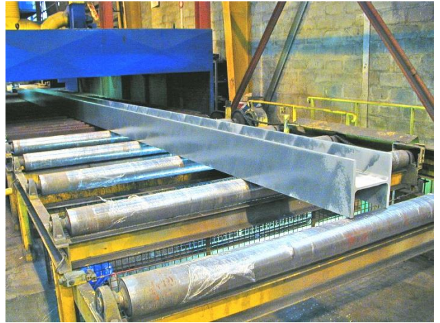
Pistolage du ZINGA