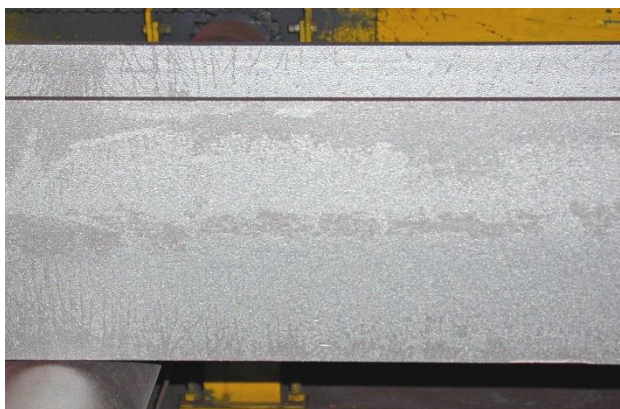
Grenailage à sec