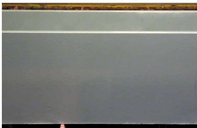
Pistolage du ZINGA