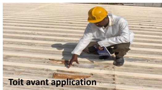
Toit avant application