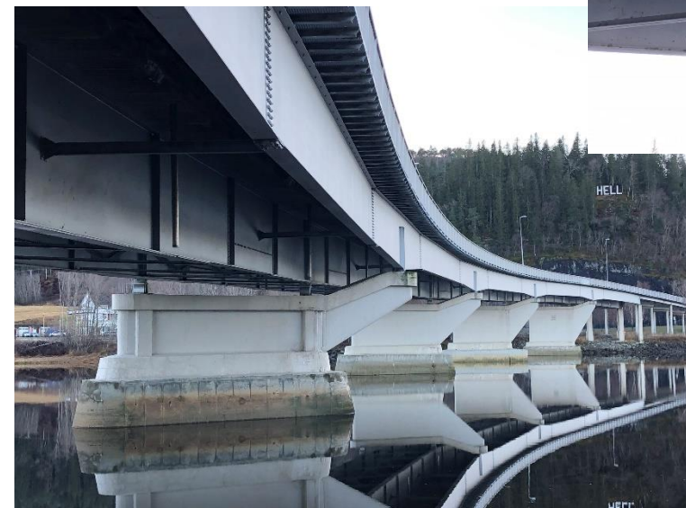
Zicht vanuit zeezijde