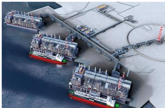
Vue d'artiste de l'Usine ARCTIC LNG-2

Le Projet ARCTIC LNG-2 est situé dans la Péninsule Gydan, dans la Baie de l'Ob, à Ynao.