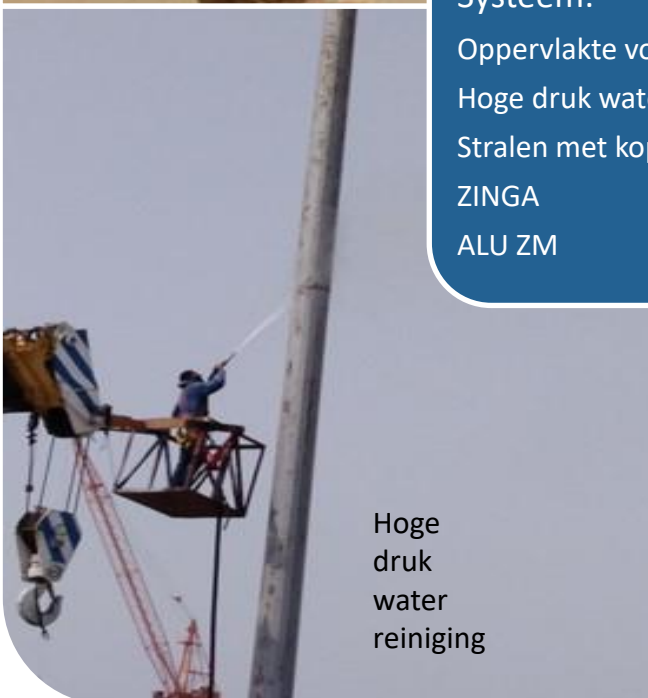
Hoge druk water reiniging