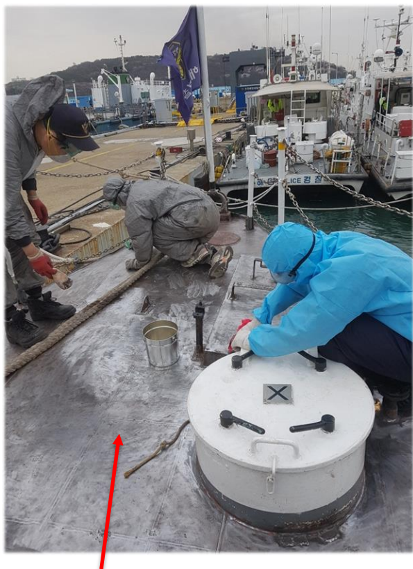
Application du ZINGA