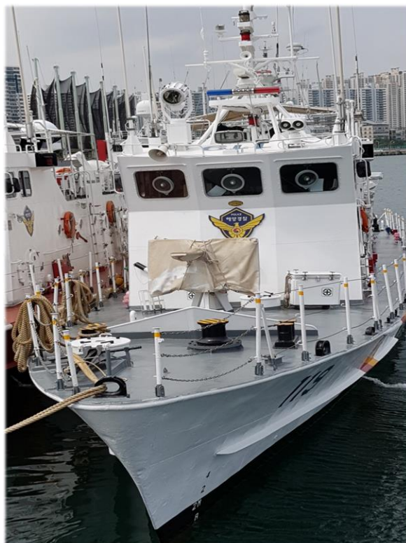
Couche de finition appliquée