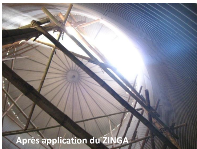
Après application du ZINGA

Système: Préparation de surface: Grenailage complet jusqu'à SA 2,5 et Rz 50-70 µm ZINGA 1 x 60 µm EFS