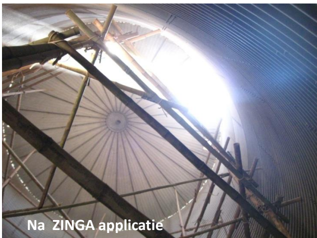
Na ZINGA applicatie

System: Oppervlakte voorbehandeling : Volledig zandstralen tot SA 2,5 en Rz 50-70 µm ZINGA 1 x 60 µm DFT