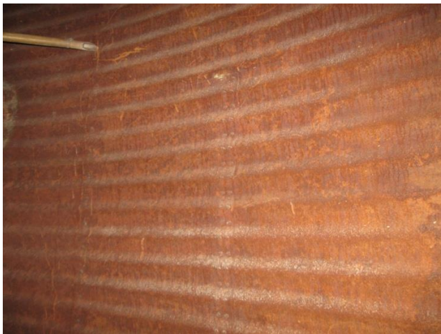
Binnenkant van de silo voor ZINGA applicatie

In totaal werd de binnenkant van 6 silo's ge-Zinganiseerd. (elk ervan heeft een oppervlakte van 700 m 2 )