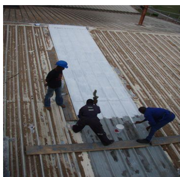
Applicatie Epoxy primer