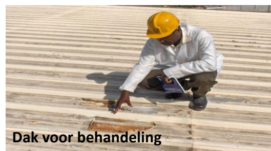
Dak voor behandeling