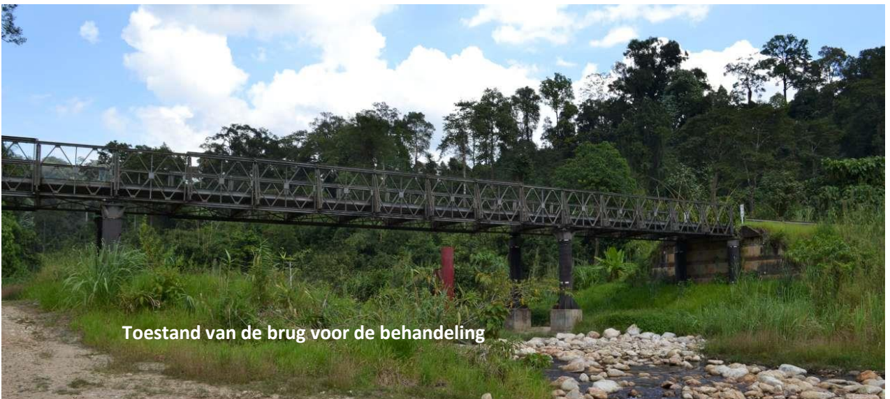
Toestand van de brug voor de behandeling

TOTAL S.A. is een Franse multinationale geïntegreerde olie- en gasmaatschappij en een van de zes "Supermajor"-oliemaatschappijen ter wereld. Haar activiteiten bestrijken de volledige olie- en gasketen, van exploratie en productie van ruwe olie en aardgas tot energieopwekking, transport, raffinage, marketing van aardolieproducten en internationale handel in ruwe olie en producten. TOTAL is ook een grootschalige fabrikant van chemicaliën. Het bedrijf heeft zijn hoofdkantoor in de TOTAL -toren in de wijk La Défense, ten westen van Parijs. Het bedrijf is genoteerd aan de beursindex Euro Stoxx 50.