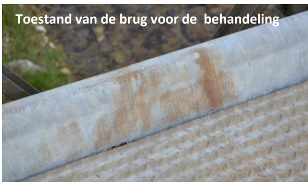
Toestand van de brug voor de behandeling

In Februari 2014 werd de TOTAL Bridge USB 100B in Myanmar gerenoveerd met ZINGA (1.606 m 2 ).