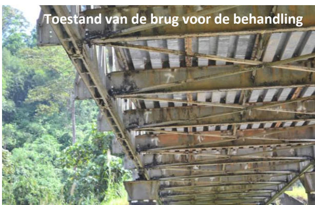
Toestand van de brug voor de behandeling