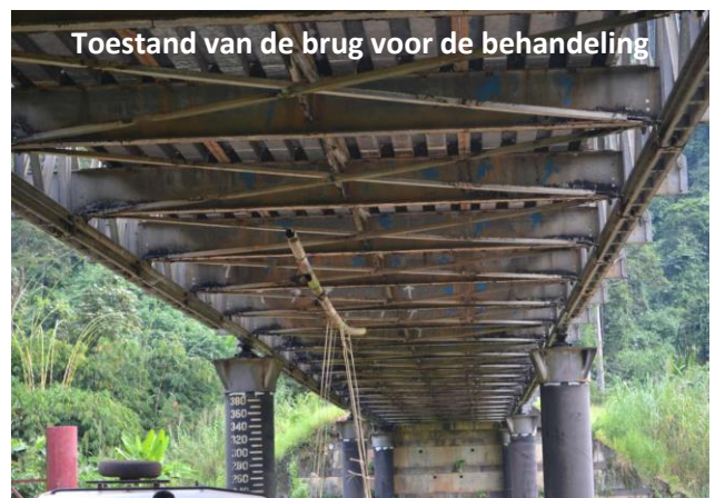
Toestand van de brug voor de behandeling

(tropische omgeving: hoge T° en vochtigheid)