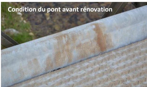
Condition du pont avant rénovation

En février 2014, le pont TOTAL USB 100B situé au Myanmar, a été rénové avec du ZINGA (1 606 m 2 ).