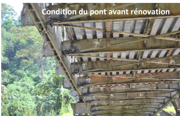
Condition du pont avant rénovation