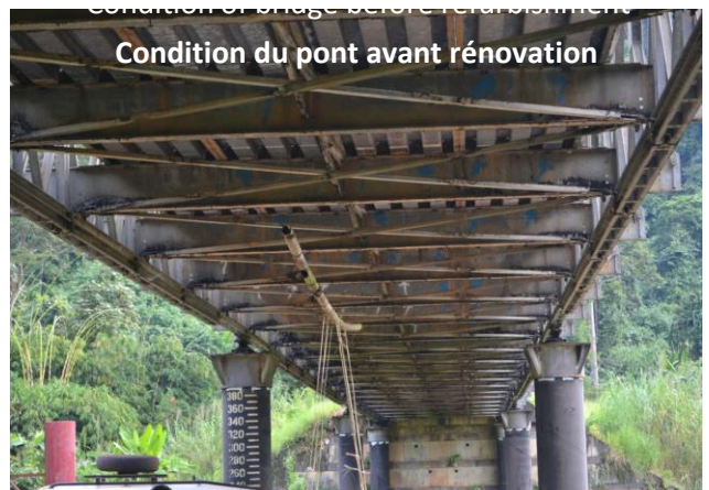
Condition du pont avant rénovation

(environnement tropical: température et humidité élevées)