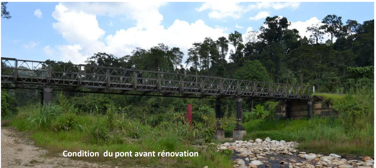
Condition du pont avant rénovation

TOTAL S.A. est une société pétrolière et gazière multinationale française intégrée et l'une des six sociétés pétrolières "Supermajor" dans le monde. Ses activités couvrent l'ensemble de la chaîne du pétrole et du gaz, depuis l'exploration et la production de pétrole brut et de gaz naturel jusqu'à la production d'électricité, le transport, le raffinage, la commercialisation des produits pétroliers et le commerce international du pétrole brut et ses dérivés. TOTAL est également un fabricant de produits chimiques à grande échelle. L'entreprise a son siège social dans la Tour TOTAL dans le quartier de La Défense, à l'ouest de Paris. La société est cotée à l'indice boursier Euro Stoxx 50.